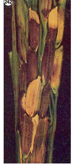
গান্ধি পোকা আক্রান্ত ধান