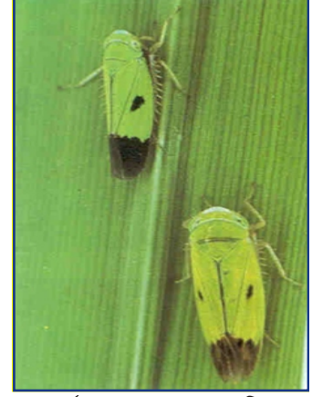
পূর্ণবয়স্ক সবুজ পাতাফড়িং

পূর্ণবয়স্ক স্ত্রী-ফড়িং পাতার খোলার ভিতরে ডিম পাড়ে। তিন থেকে পাঁচ দিনের মধ্যে ডিম থেকে কিড়া বের হয়। কীড়া থেকে পূর্ণবয়স্ক ফড়িং হতে ১৫-২১ দিন সময় লাগে। পূর্ণবয়স্ক ফড়িং ২৫ দিন পর্যন্ত বেঁচে থাকতে পারে।