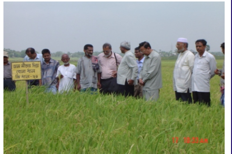
ড্রামসিডারে বপনকৃত জমি

গাজীপুরের বোর্ড বাজার এলাকার চাষীরা ড্রামসীডার দিয়ে বোনা ধানে মাত্র দুটি হাত নিড়ানি দিয়েই সুফল পেয়েছেন।