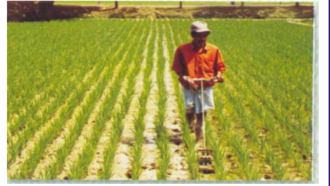
ব্রি উইডার দিয়ে নিড়ানী