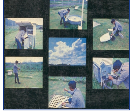
আবহাওয়ার উপাত্ত সংগ্রহ