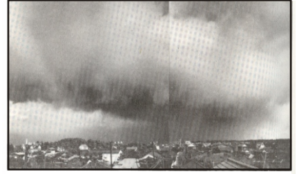
মেঘ ও বৃষ্টিপাত

মাটির আর্দ্রতা প্রধানত বৃষ্টিপাতের ওপর নির্ভরশীল। ধান গাছ তার জীবন চক্রের প্রত্যেক পর্যায়েই মাটির আর্দ্রতার উপর নির্ভর করে। তবে কাইচ থোর থেকে ধানের দুধ আসা পর্যন্ত স্তর মাটির আর্দ্রতার অভাবে বেশী ক্ষতি হয়।