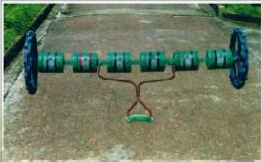
ছবি-১ঃ ড্রাম সীডার

প্রায়িকের তৈরী ৬টি ড্রাম একটি লোহার দন্ডে পর পর সাজানো থাকে যার দৈর্ঘ্য ২ মিটার। লোহার দন্ডের দুই প্রান্তে প্রায়িকের তৈরী ২টি চাকা এবং যন্ত্রটি টানার জন্য একটি হাতল যুক্ত থাকে (ছবি-১)।