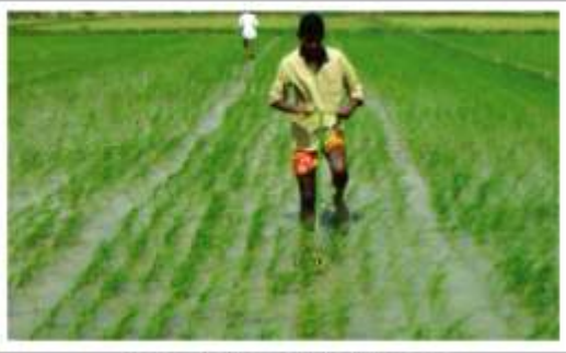
ছবি ৪: ট্রি-উইজার দ্বারা আপাছা দমন

সরাসরি বোনা ধানে আপাছাই প্রধান সমস্যা হতে পারে। বপনের প্রথম ৪০-৫০ দিন জমি অবশ্যই আপাছামুক্ত রাখতে হবে। নিড়ানী বা উইজার দ্বারা আপাছা দমন করা সহজ। সারিতে বপন হয় বিধায় ট্রি-উইজার ব্যবহারে কোনই সমস্যা নেই (ছবি-৪)। তবে উইজার প্রয়োগের পর হাত দিয়ে সারির ভিতরকার আপাছা পরিষ্কার করা আবশ্যিক। প্রয়োজনে উপযুক্ত সময়ে ও পরিমিত মাত্রায় আগাছানাশক ব্যবহার করা যেতে পারে। এক্ষেত্রে বোরো মৌসুমে বীজ বপনের ৮-১০ দিন পরে জমিতে ২০-৩০ মিলিলিটার রনস্টার ১০ লিটার পানিতে মিশিয়ে প্রতি ৫ শতাংশ জমিতে সমানভাবে স্বেত্র করতে হবে।