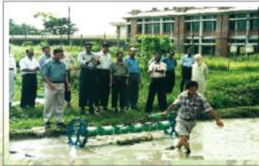
ছবি ২ঃ ড্রাম সীডার দিয়ে বীজ বপন

বীজ (কমপক্ষে ৮০% গজানোর ক্ষমতা সম্পন্ন) ২৪ ঘণ্টা পানিতে ভিজিয়ে এবং পরে ৩ থেকে ৪ দিন জল দিয়ে ভালভাবে অক্লুরিত করে নিতে হবে। তবে অক্লুরিত বীজের শিকড় যেন এতটা লম্বা না হয় যাতে একটির সঙ্গে আরেকটি পঁচিয়ে যায়। ড্রামে বীজ ভরার আগে অক্লুরিত বীজ ১-২ ঘণ্টা ছায়ায় ছড়িয়ে দিয়ে বাতাসে শুকিয়ে কব কব করে নিলে ভাল হবে। বোনার সময় হাতলের সাথে ২-৩ ফুট লম্বা চিকন এক খন্ড কালা গাছ বেধে নিলে (হালকা মই হিসাবে) জমিতে পায়ের দাগ বা গর্ত মুছে যাবে এবং কিছু বীজের অপচয়ও রোধ হবে (ছবি ২)।